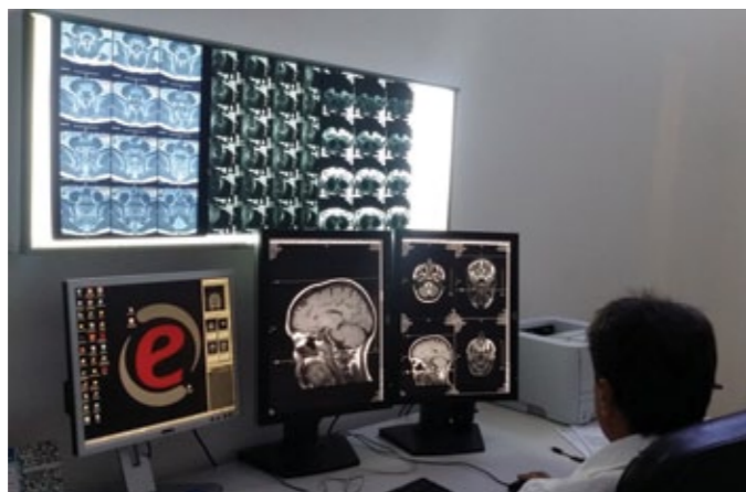
Il medico radiologo referta l'esame.